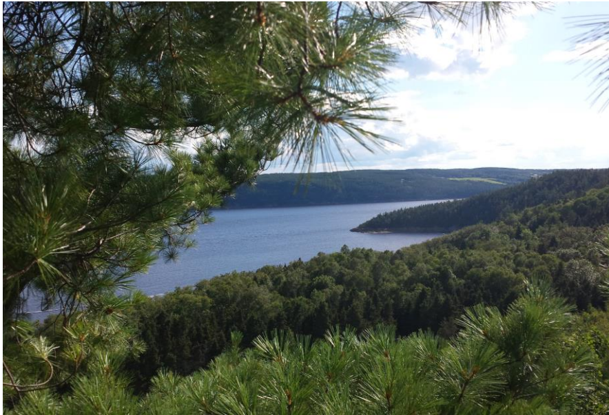
Vue depuis le parcours de « Fjord en arbres » du Parc aventure Cap Jaseux