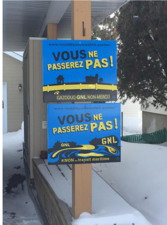
Affichage de l'opposition du projet sur des terrains privés.