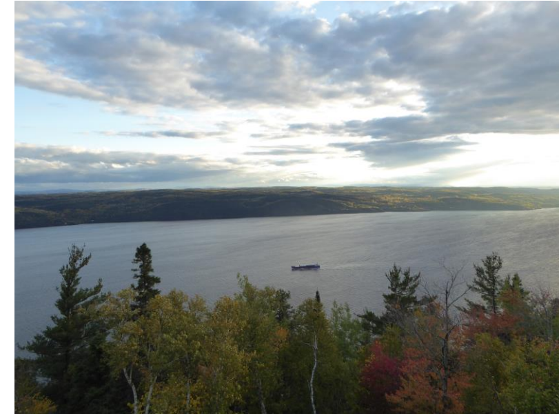
Vue depuis la Pourvoirie du Cap au leste